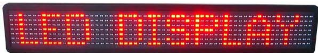
Abbildung: 7x64 Pixel – 100 mm Zeichenhöhe, ca. 10-13 Zeichen **

www.led-laufschriften.de - www.lcdanzeigen.de